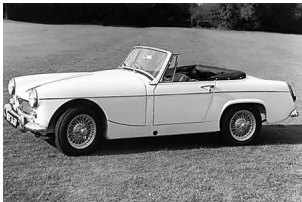
世界の名車<第163回>“着こなし”で悩む「MGミジェット」