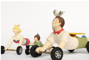
何コレ！？誰もが思わずそう口にする、岡モータース