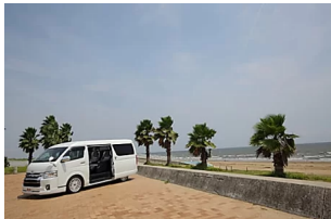
「横向き座席禁止」ハイエースのキャンピングカーに規格変更車両が登場！