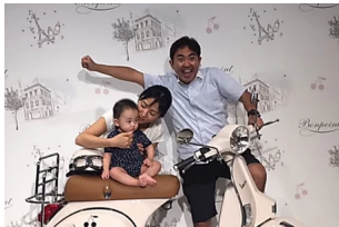
落語家の林家三平 子育てを通して亡き父・初代林家三平を想う