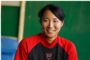
女子アスリート応援団