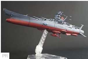
大人になったファンたちへ。匠の造形で蘇った「宇宙戦艦ヤマト」が発進！ 価格.comマガジン