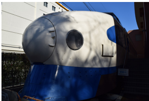
世界最速記録をつくった新幹線の保存車両を見に国立駅へ