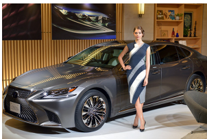
斬新なクーペシルエットを導入した新型LSが狙うもの