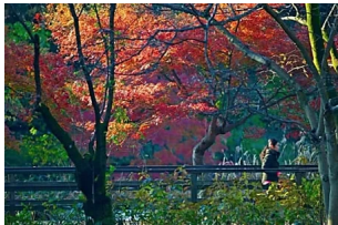
都内を走る？ それとも遠出して走る？ 紅葉シーンが堪能できる“絶...