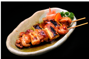
激安居酒屋チェーンのカラクリ教えます