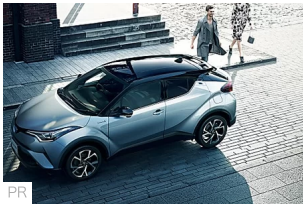
世界が認め歴史が証明する技術と性能、進化を続けるトヨタの最新SU... TOYOTA SUV COLLECTION