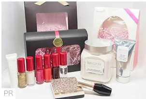
今年の資生堂ギフトセレクションがすごい！最高のプレゼントに 資生堂ギフトセレクション on 肌らぶ